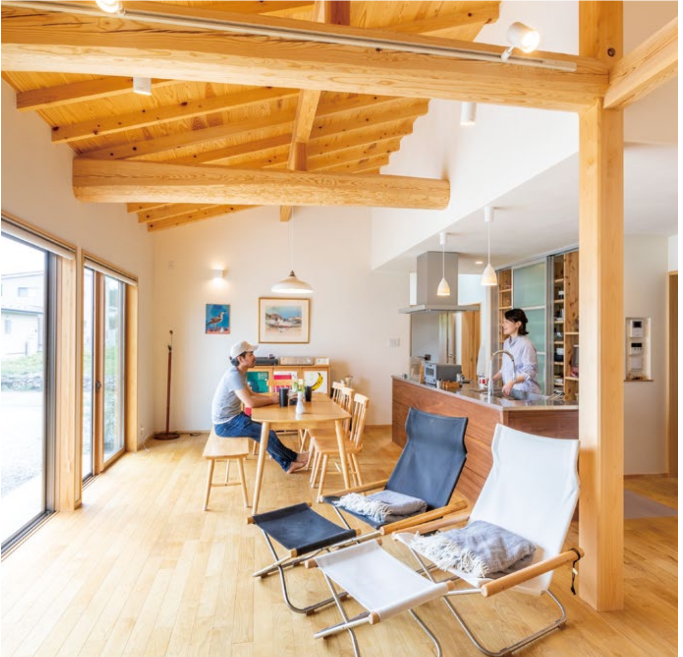
Text · Miho Ogihara